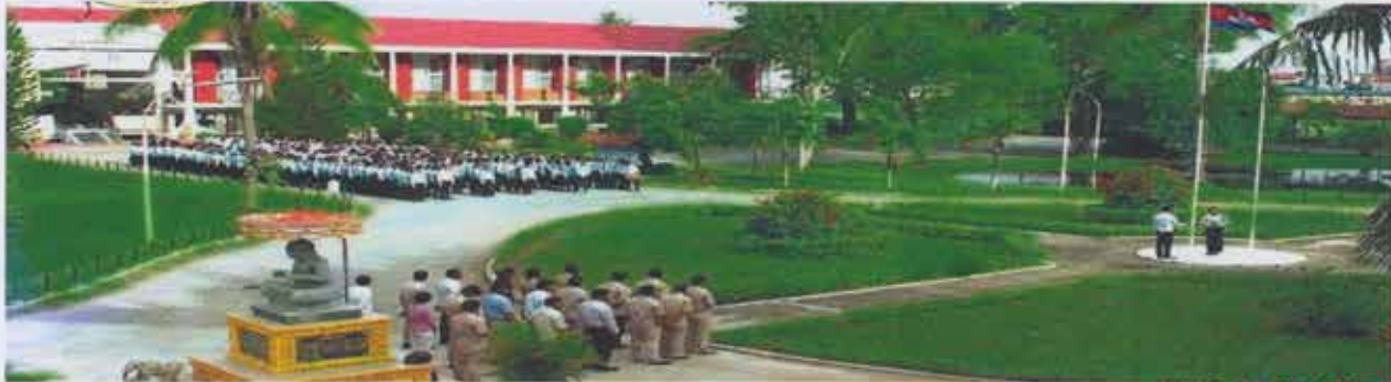
សៀវភៅព័ត៌មានទូទៅរបស់គ្រឹះស្ថានអប់រំបណ្តុះបណ្តាលបច្ចេកទេស និងវិជ្ជាជីវៈ