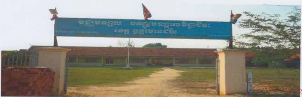
សៀវភៅព័ត៌មានទូទៅរបស់គ្រឹះស្ថានអប់រំបណ្តុះបណ្តាលបច្ចេកទេស និងវិជ្ជាជីវៈ