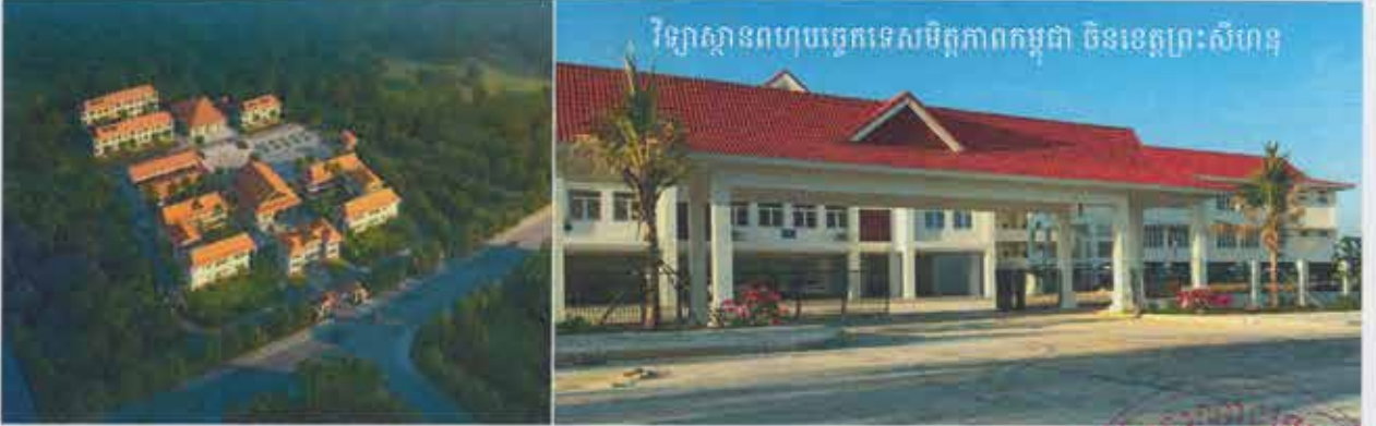
សៀវភៅព័ត៌មានទូទៅរបស់គ្រឹះស្ថានអប់រំបណ្តុះបណ្តាលបច្ចេកទេស និងវិជ្ជាជីវៈ