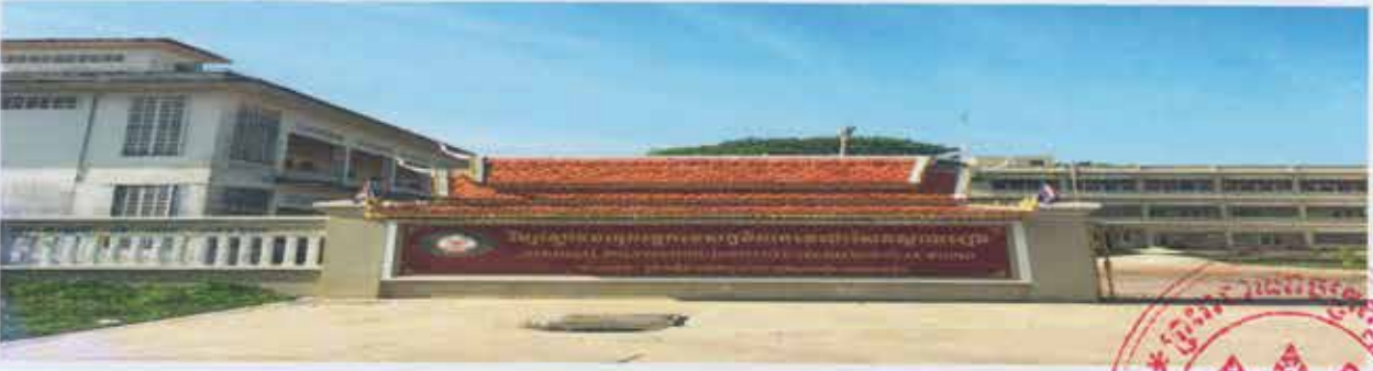
សៀវភៅព័ត៌មានទូទៅរបស់គ្រឹះស្ថានអប់រំបណ្តុះបណ្តាលបច្ចេកទេស និងវិជ្ជាជីវៈ