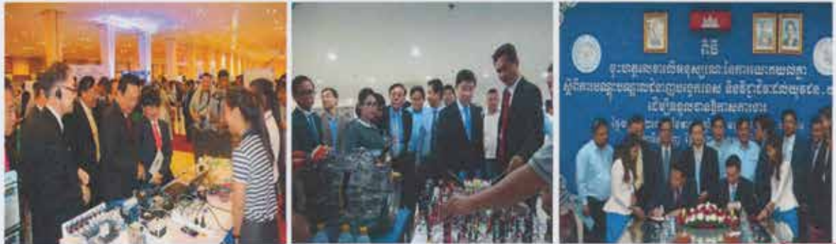
សៀវភៅព័ត៌មានទូទៅរបស់គ្រឹះស្ថានអប់រំបណ្តុះបណ្តាលបច្ចេកទេស និងវិជ្ជាជីវៈ

បន្តកែលម្អប្រព័ន្ធគ្រប់គ្រងព័ត៌មានអប់រំបណ្តុះបណ្តាលបច្ចេកទេស និងវិជ្ជាជីវៈ និងប្រព័ន្ធព័ត៌មានទីផ្សារការងារ ព្រមទាំងពង្រឹងការវិភាគ ព្យាករណ៍ទីផ្សារការងារ និងការស្ទង់មតិលើតម្រូវការជំនាញ