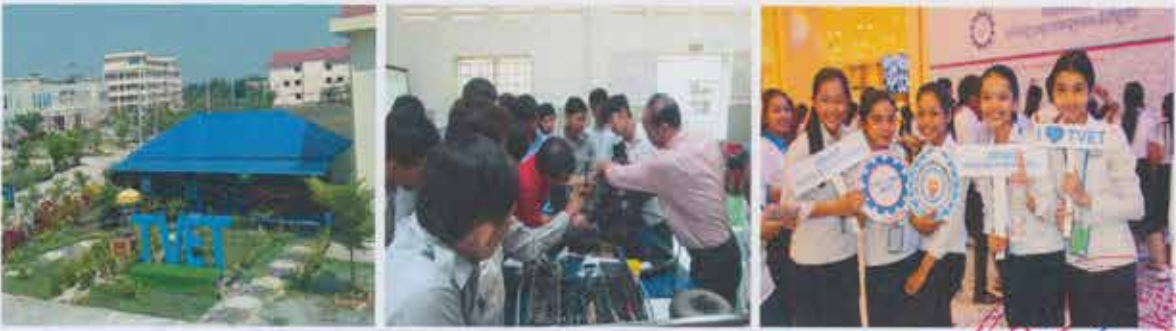
សៀវភៅព័ត៌មានទូទៅរបស់គ្រឹះស្ថានអប់រំបណ្តុះបណ្តាលបច្ចេកទេស និងវិជ្ជាជីវៈ