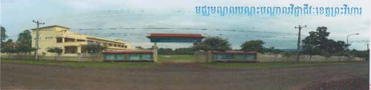
មជ្ឈមណ្ឌលបណ្តុះបណ្តាលវិជ្ជាជីវៈខេត្តព្រះវិហារ

សៀវភៅព័ត៌មានទូទៅរបស់គ្រឹះស្ថានអប់រំបណ្តុះបណ្តាលបច្ចេកទេស និងវិជ្ជាជីវៈ