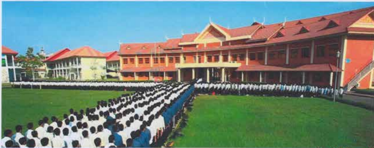
សៀវភៅព័ត៌មានទូទៅរបស់គ្រឹះស្ថានអប់រំបណ្តុះបណ្តាលបច្ចេកទេស និងវិជ្ជាជីវៈ