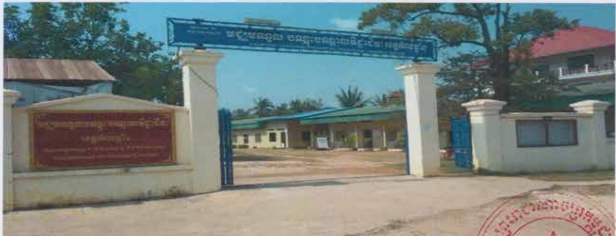
សៀវភៅព័ត៌មានទូទៅរបស់គ្រឹះស្ថានរបស់បណ្តុះបណ្តាលបច្ចេកទេស និងវិជ្ជាជីវៈ