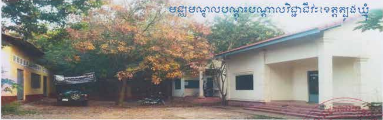
មជ្ឈមណ្ឌលបណ្តុះបណ្តាលវិជ្ជាជីវៈខេត្តក្បូងឃ្មុំ

សៀវភៅព័ត៌មានទូទៅរបស់គ្រឹះស្ថានអប់រំបណ្តុះបណ្តាលបច្ចេកទេស និងវិជ្ជាជីវៈ