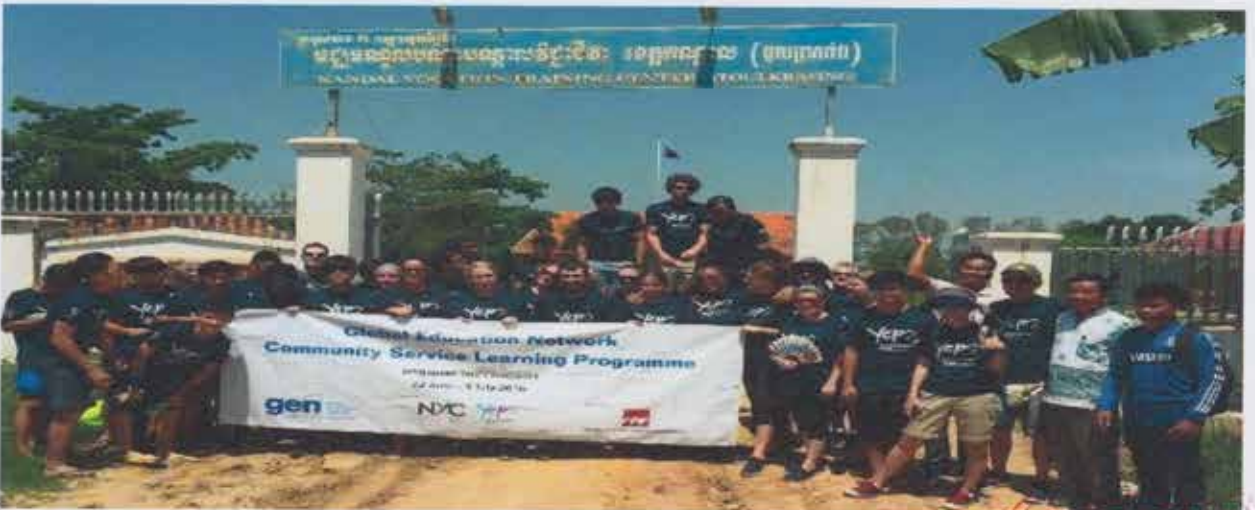
សៀវភៅព័ត៌មានទូទៅរបស់គ្រឹះស្ថានអប់រំបណ្តុះបណ្តាលបច្ចេកទេស និងវិជ្ជាជីវៈ