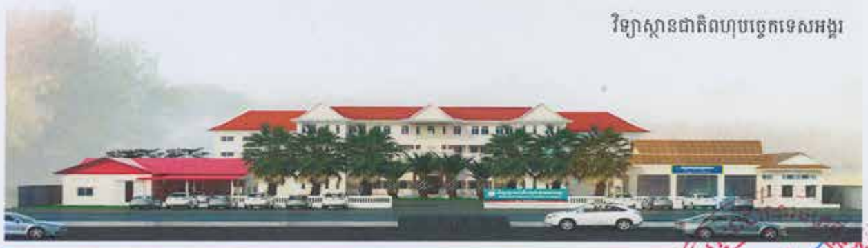
វិទ្យាស្ថានជាតិពហុបច្ចេកទេសអង្គរ